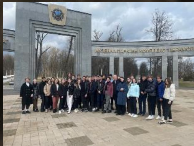
Белорусский государственный музей истории Великой Отечественной войны