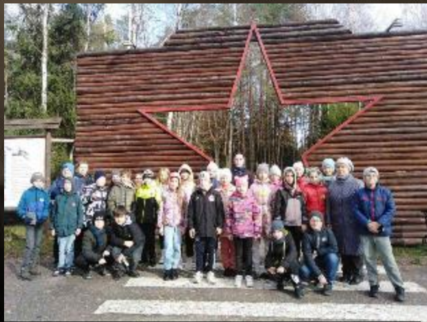
Военно-исторический комплекс «Партизанский лагерь»