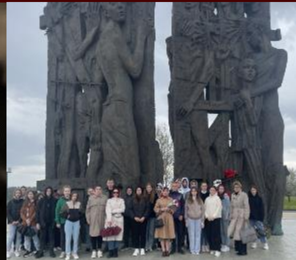
Мемориальный комплекс «Троstenец»